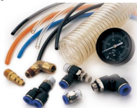
Conectores neumáticos, mangueras de poliuretano y unidades de mantenimiento