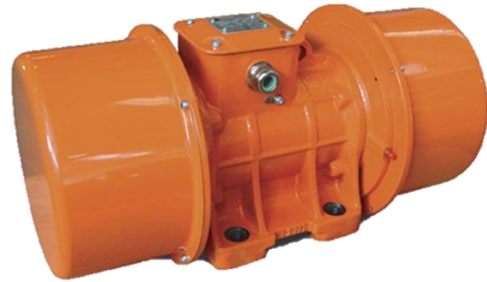
Vibradores eléctricos externos - MVE-Milling