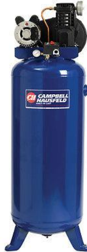
Tanque vertical de 5hp