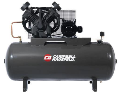
Motor trifásico de 15hp

Campbell Hausfeld y compresores de tornillo y secadores marca ALUP .