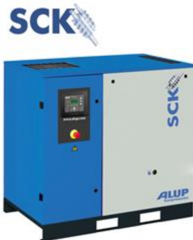
Compresor de tornillo