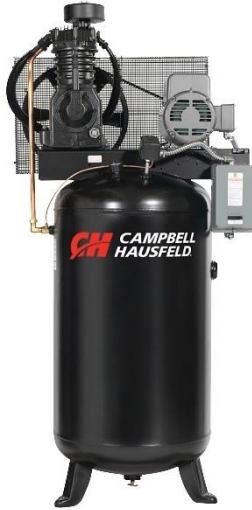
Compresor vertical monofásico de 5hp