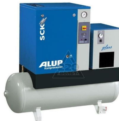
Compresor de tornillo con tanque